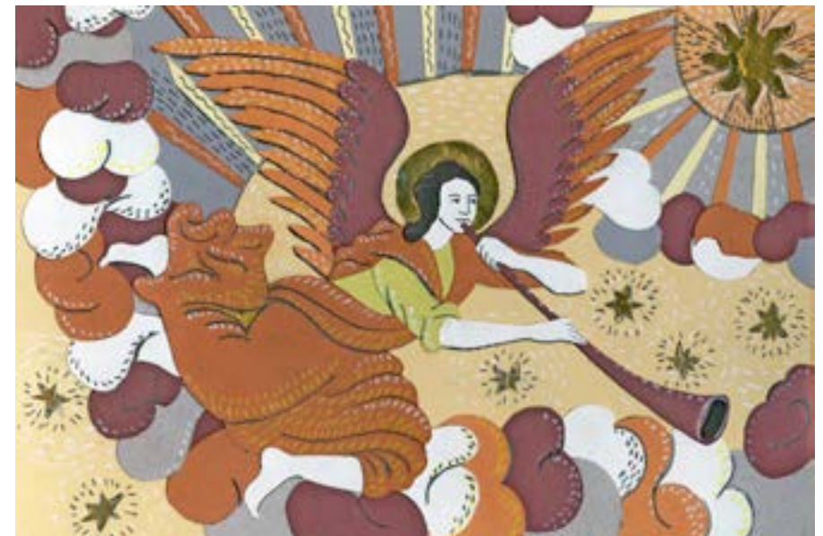
Рождественская открытка по мотивам гравюр XVII века Василия Корени. Екатерина Ордынская, 2015