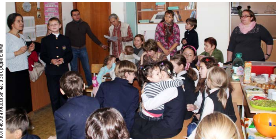
Поздний классный час в 5б с родителями