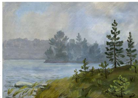
Туман на озере. Ансер. 2005

брое, вечное... И чем больше таких поисков, тем скорее идёт разрушение.