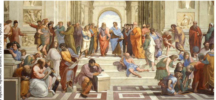
Репродукция. Афинская школа. 1510-1511. Фреска

Для древних греков красота – это космос. Они соединяли в понятия «космос» представления и о порядке, и о красоте. Космос божествен и противопоставлен хаосу, а человек рассматривался как часть космоса.