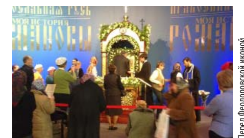
Перед Фёдоровской иконой