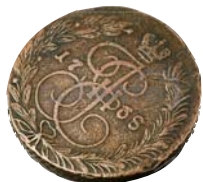
Монета из коллекции автора