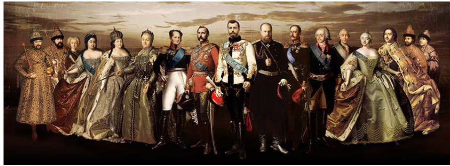
Центральное панно на выставке

Выставку «Православная Русь. Романовы», проходившую в «Манеже» в Москве с 4 по 24 ноября 2013 года, посетили более 300 тысяч человек. Среди них и большинство учителей и учащихся нашей школы