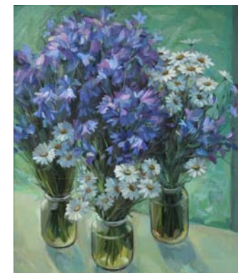
Букеты. 1994, холст, масло