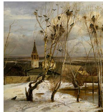
А.К. Саврасов. «Грачи прилетели». 1871

Алексей Кондратьевич написал эту картину во время своего полугодового