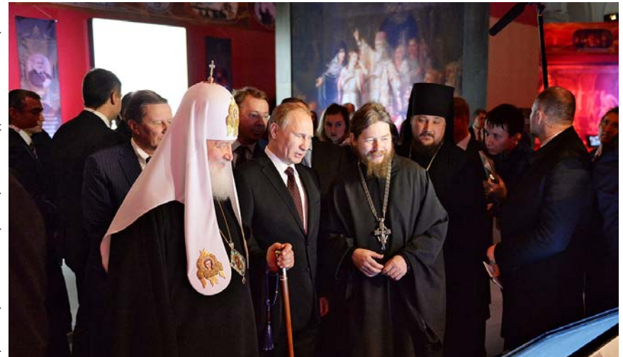
Архимандрит Тихон (Шевкунов) проводит экскурсию.

Выполнение экспонатов. Интерактивные доски там, где можно было самим посмотреть эпохи, открытия, карты, как шли бои, достижения, постройки. А ещё высказывания.