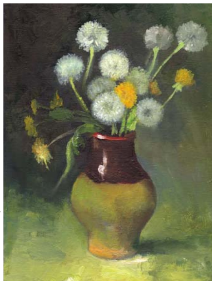
Работа Евгении Лазаревой