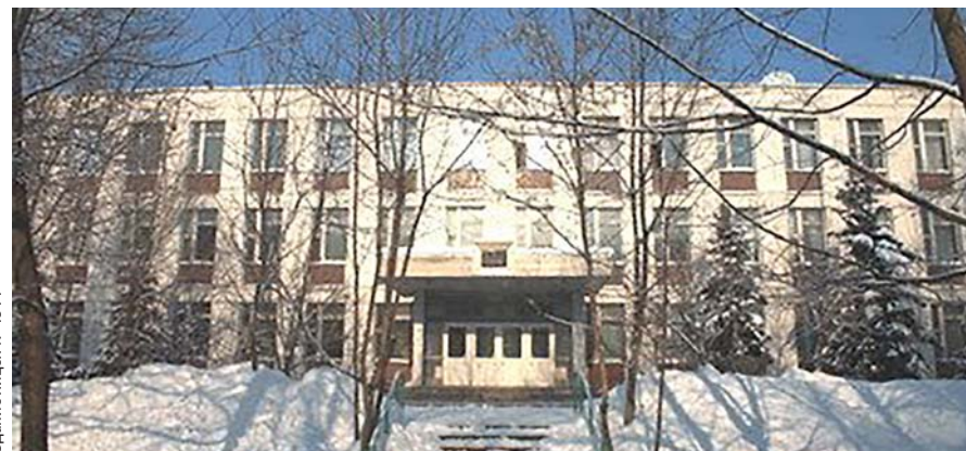
Здание лицея № 1511