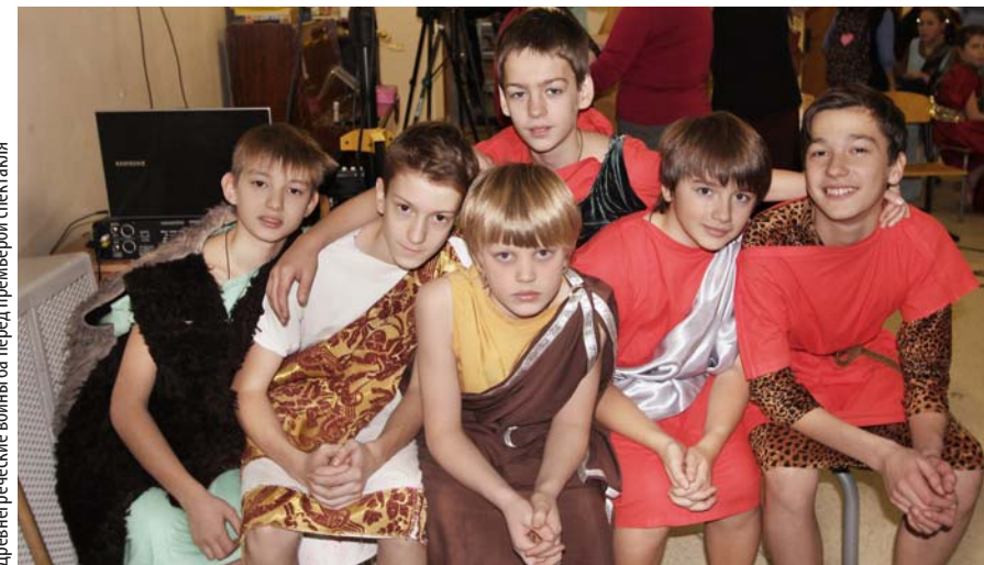
Древнегреческие воины ба перед премьерой спектакля

А началось всё... как ни странно, с 5 класса. Вот как это было.