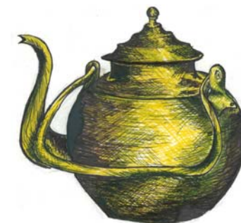
Работа Николая Горюнова