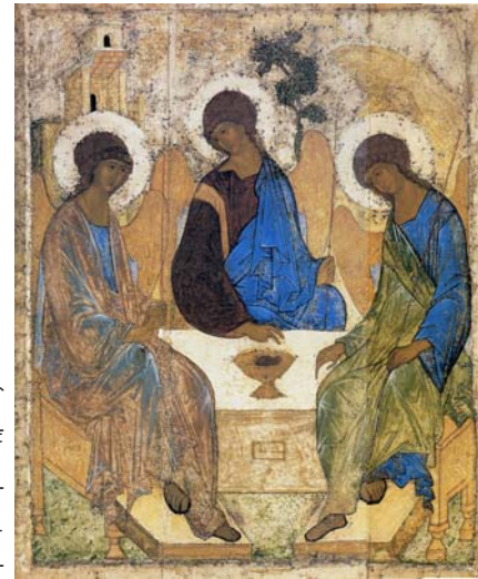
«Троица». Прп. Андрей Рублёв. XV век

Человеческое искусство, в презрении к бытию и к личности, может рождать самые зверские образы. В момент испытания, как высоко символически об этом повествует книга Бытия: «...увидела жена, что дерево хорошо для пищи, и что оно приятно для глаз и вожделенно» (Быт 3:6). Так прекрасное становится внешней ценностью по отношению к личной связи, объединявшей Бога с первыми людьми и людей между собой. Внешняя привлекатель-