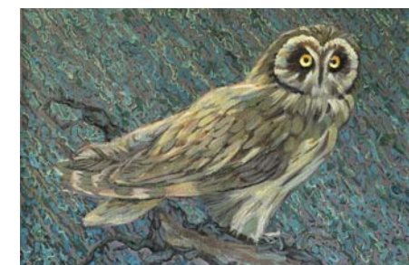
Сова. 1999, холст, акрил