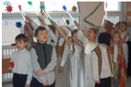
Выступает 3а.