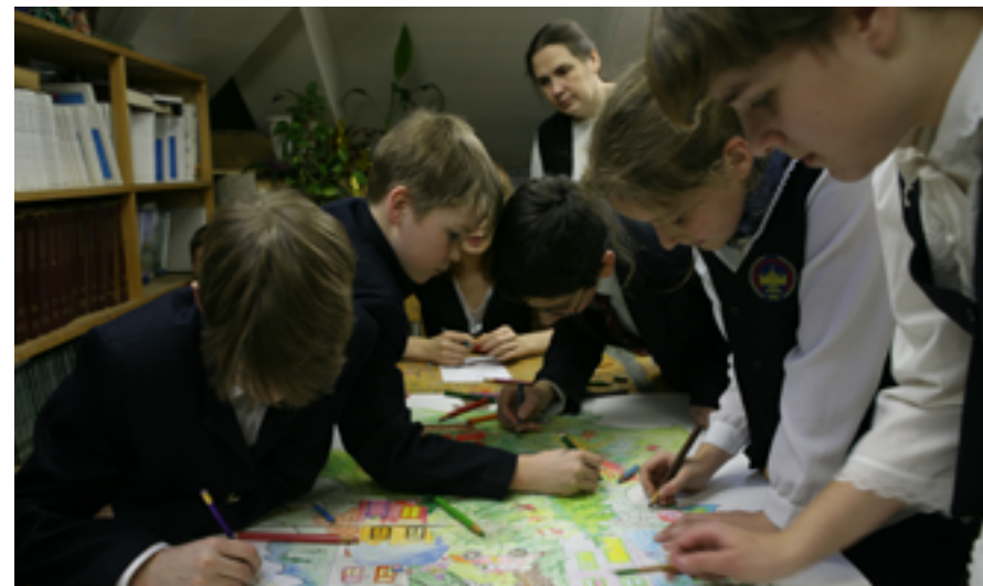
Художественная станция.