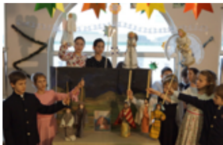
Выступает 4а.

После всех мероприятий на 3 этаже начальная школа спустилась в спортивный зал на премьеру спектакля «Холодное сердце».