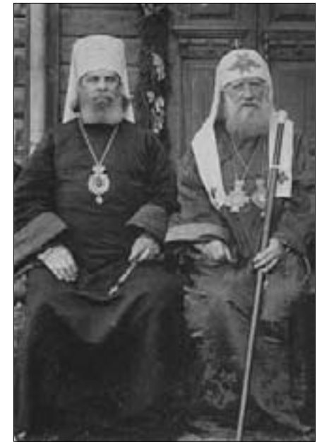
Патриарх Тихон и митрополит Петр, 1924 год

Наша школа носит имя священномученика Петра (Полянского), митрополита Московского и Крутицкого, – замечательного новомученика, великого столпа Церкви, сподвижника и преемника святителя Тихона, патриарха Всероссийского. Всё его священное служение было выбором