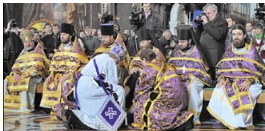
Патриарх Московский и всея Руси Кирилл в Великий четверг совершает чин омовения ног. Крайний справа иерей Филипп Ильяшенко.