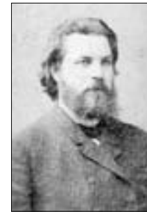
Петр Федорович Полянский, будущий митрополит

Христианство восприняло и усвоило эту традицию, но наполнило её новым исключительным содержанием. При рождении в жизнь Церкви, в Таинстве Крещения, новопросвещенный получает имя в честь святого, того человека, который угодил Богу своей жизнью или служением, своей смертью за Христа и Церковь. Таким образом устанавливается особая мистическая связь между получающим имя и тем праведником Божиим, чьим именем он нарекается. Эта традиция греко-русская – давать всякому крещаемому имя какого-либо святого. В практике некоторых поместных Церквей имя