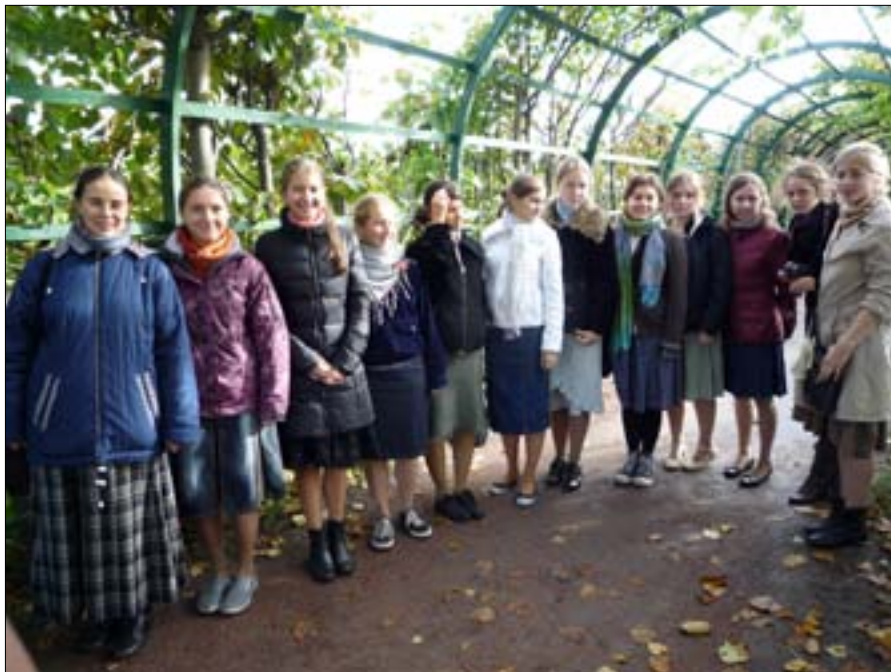
Петергоф 2010.

О своих путешествиях с 7 по 11 классы рассказывает 11б