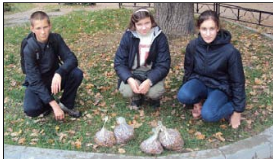
Трое экологов из 8 класса.