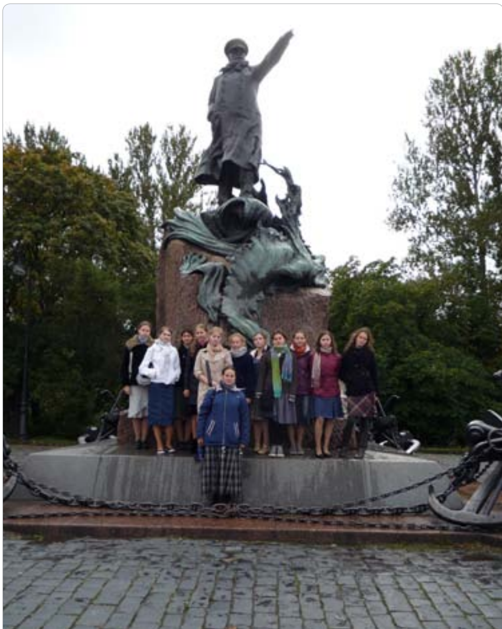
Памятник адмиралу Макарову, Петергоф, 2010. Фотография Александры Владимировской (11а)